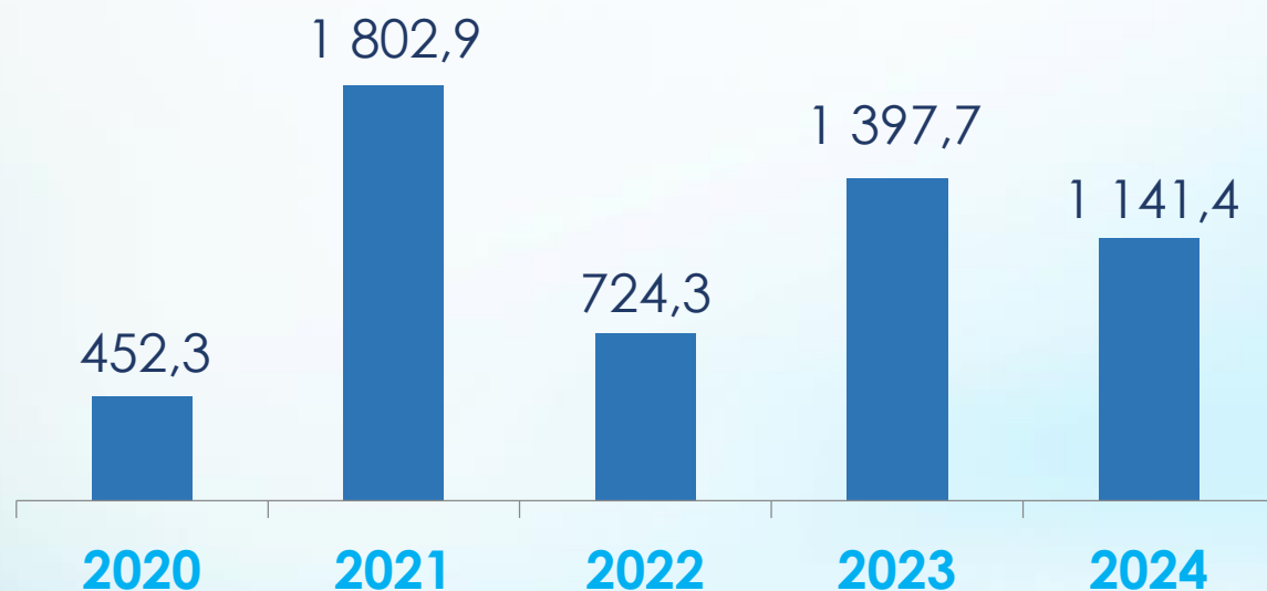
Налоговые поступления в консолидированный бюджет Республики Карелия млн. рублей*

Инвестиционные проекты для реализации которых юридическим лицам предоставлены земельные участки в аренду без проведения торгов в соответствии с Законом Республики Карелия от 16 июля 2015 года № 1921-ЗРК